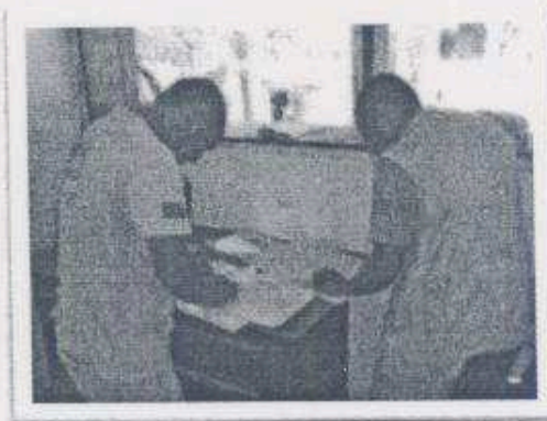
Imagen 21- 22. Conteo Cruzado de boletos