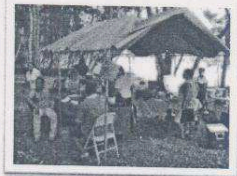
Imagen 15-16: Servicio de alimentación en el área de Uso Publico.

8.6 Al momento de finalizar el evento, la salida fue de forma ordenada, se distribuyeron las personas en 4 viajes de Microbuses y otros prefirieron utilizar el servicio de lancha; los servicios de alquiler de trasporte fueron de la comunidad, y en la Garita de cobro de encontraban las motos parqueadas las cuales utilizaron para regresar a la Ciudad de Flores Petén,