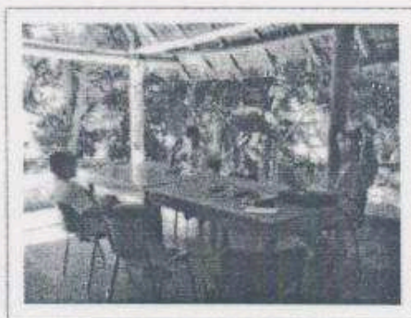
Imagen 1. Reunión de trabajo entre CONAP e IDAEH