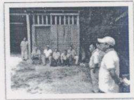
Imagen 20 - 21: Reunión con el grupo de Vigilancia