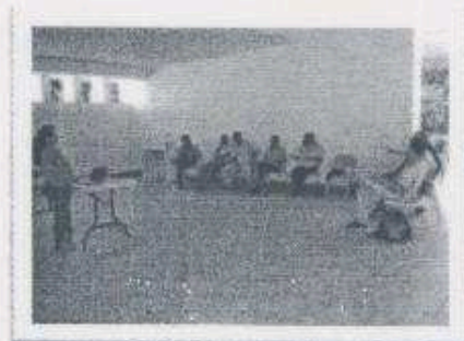
Imagen 2 - 3. Presentación del proceso de RUV