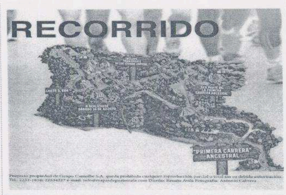
Figura 1: Recorrido propuesto para la Carrera en Yaxha