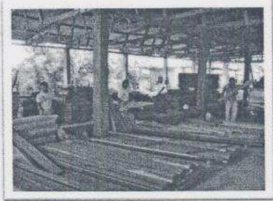
Imagen10: Aserradero de Suchitecos