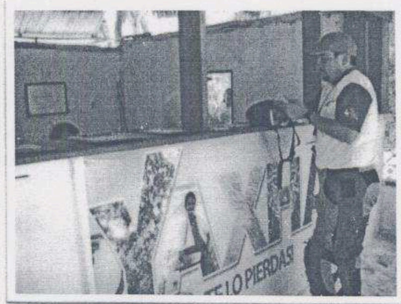
Imagen 12: Pago al Ingreso

8.1 En el proceso de ingreso al Parque Nacional Yaxha Nakum Naranjo, una persona del STAFF (Tesorero) del Club BMW motorrab Guatemala, se encargo de realizar el pago en la garita de cobro, en base a lo reportado en la entrega de brazaletes,