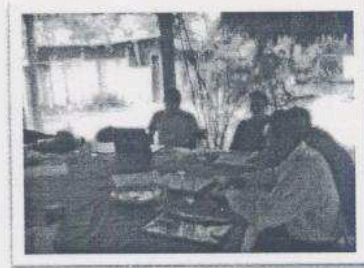
Imagen 7: Llenado de Encuestas