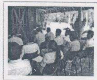
Imagen 4-5 Presentación del Acuerdo No. 187-2007-D