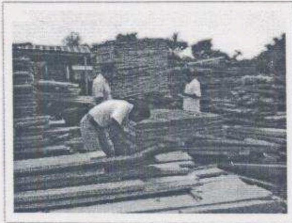
Imagen 8: Aserradero de El Esfuerzo

6.1 Se tuvo el apoyo de la concesión Sociedad Civil El Esfuerzo de Melchor de Mencos Petén en proporcionar 0.27 metros cúbicos de madera de Santa María para el Parque Nacional Yaxha Nakum Naranjo y poder iniciar a elaborar puertas en los lavamanos de los servicios sanitarios que se encuentran en el área y utilizándolos por los vigilantes para guardar los insumos de limpieza,