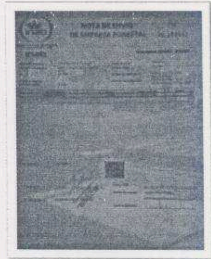
Imagen 9: Nota de Envío de Empresa No. 152641

7.1 Se tuvo el apoyo de la concesión Impulsores Suchitecos de Desarrollo Integral Sociedad Civil en Melchor de Mencos Petén en proporcionar 0.18 metros cúbicos de madera de Santa María para el Parque Nacional Yaxha Nakum Naranjo para la elaboración de puertas en los lavamanos de los servicios sanitarios que se encuentran en el área, utilizándolos para que los vigilantes puedan guardar los insumos de limpieza,