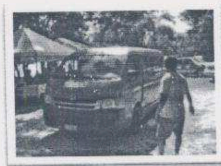
Imagen 17-18: Servicio de traslado por medio de buses en la salida del PNYNN.

9.1 Se tuvo una reunión con los Operadores de Turismo de Petén, en donde solicitaban el apoyo del personal del Parque Yaxha Nakum Naranjo para poder apoyarles en la observación de los atardeceres en el Templo de Manos Rojas, se llegaron a los acuerdos para llevar un mejor control: