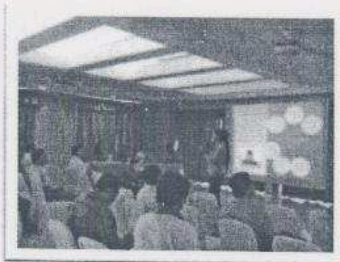
Imagen 23.- Presentación de la estrategia de Turismo en el SIGAP.

Quedando el acuerdo en crear una Mesa de Coordinación Interinstitucional para dar seguimiento a las líneas estratégicas mencionadas con anterioridad.